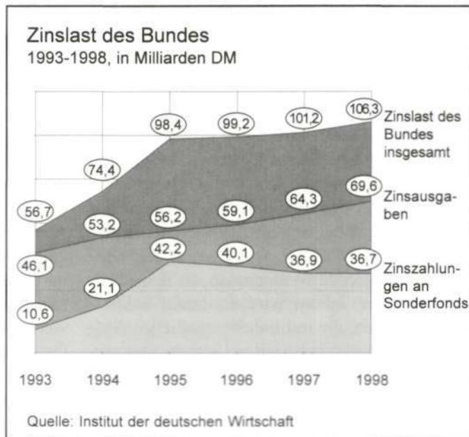
Zinslast des Bundes 1993-1998, in Milliarden DM

verschuldung deutlich unter 3 Prozent des Bruttoinlandprodukts (BIP) gedrückt werden. Nur dann kann es gelingen, die horrende Staatsverschuldung wieder unter 60 Prozent des BIP zu bringen. Der sprunghafte Anstieg der Schulden, insbesondere durch den Treuhandfonds, den Kreditabwicklungsfonds, den Fonds Deutsche Einheit und die Übernahme von Alt-schulden im Wohnungsbestand erhöht nicht nur den Kapitalmarktzins und verdrängt damit private Investitionen. Er läßt den Anteil der Zinsaufwendungen im Bundeshaushalt im nächsten Jahr auf über 20 Prozent der Gesamtausgaben hochschnellen. Eine derartige Zinsbelastung schränkt die Manövrierfähigkeit des Staates immer mehr ein und macht ihn gerade auch da handlungsunfähig, wo er wirklich gebraucht wird.